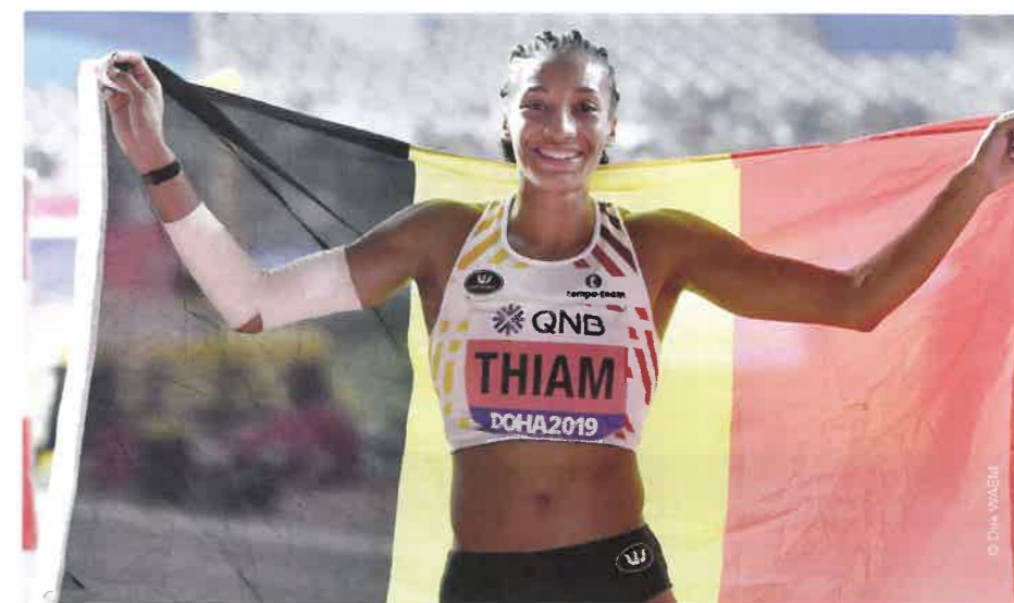
La championne olympique Nafissatou Thiam, a reçu l'aide du "Projet de vie" pour concilier sa carrière sportive et ses études

Au niveau de l'enseignement secondaire (12 à 18 ans), au total des fédérations sportives, 1249 jeunes sportifs sous statut sont identifiés. Ils reçoivent tous un Carnet d'Entraînement et de Liaison et bénéficient :